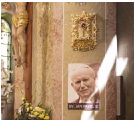
Relikviář s ostatky sv. Jana Pavla II., 2015, foto Š. Gottwald.