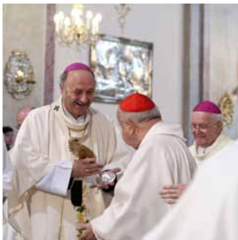
Předání relikvie, 2015, foto T. Hrubá.