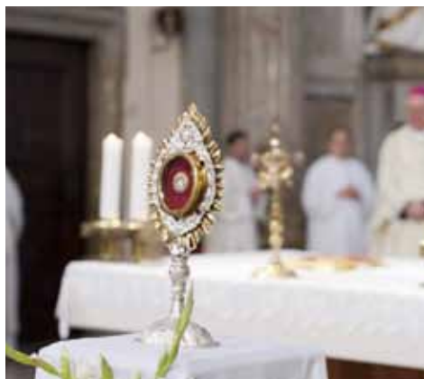
Vystavení ostatku sv. Jana Pavla II., 2015, foto T. Hrubá.