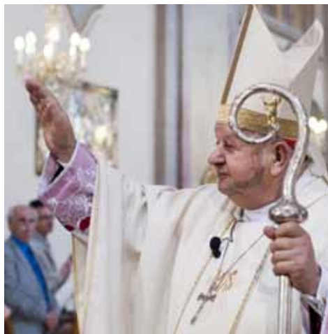
Kardinál S. Dziwisz na Svatém Kopečku, 2015