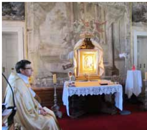
V kapli na Svatém Kopečku, 2015.

V úterý proběhlo rozloučení v opatské bazilice Nanebevzetí Panny Marie v Praze na Strahově. Po mši svaté byla na přání rodiny rakev s ostatky zesnulého kněze převezena a uložena do rodinného hrobu v Úhonicích u Kladna, kde otec Bernard prožil své dětství a mládí (narodil se v Praze 20. března 1971). Během dospívání prožil vnitřní konverzi. Před šestadvaceti lety se rozhodl vstoupit k premonstrátům na Strahově (1994). Slavné sliby složil 1. května 1999. Vysvěcen na kněze byl 29. června 2000. Letos by oslavil dvacet let kněžství. Jeho prvním působištěm byla Jihlava, kde byl kaplanem. O dva roky později odešel do Doksan, odkud spravoval sousední Brozany a Dolánky. Na Svatý Kopeček přišel roku 2005. Poutnímu místu zasvětil zbytek života, o čtyři roky později převzal vedení farnosti. Hospitalizován byl v květnu 2019 po návratu z cesty do Polska, během které mu již nebylo dobře (s několika farníky a spolubratry se 17. a 18. května vypravili na místa spojená se Svatým otcem Janem Pavlem II.). Když mu to zdravotní stav umožnil, odpočíval a nabíral síly u sester premonstrátek na Svatém Kopečku, odkud občas vycházel do přírody. Návštěvy nebyly povoleny z důvodu jeho oslabeného organismu. Podstoupil náročnou a zatěžující léčbu a dvě transplantace kostní dřevě. V posledním okamžiku nebyl sám.