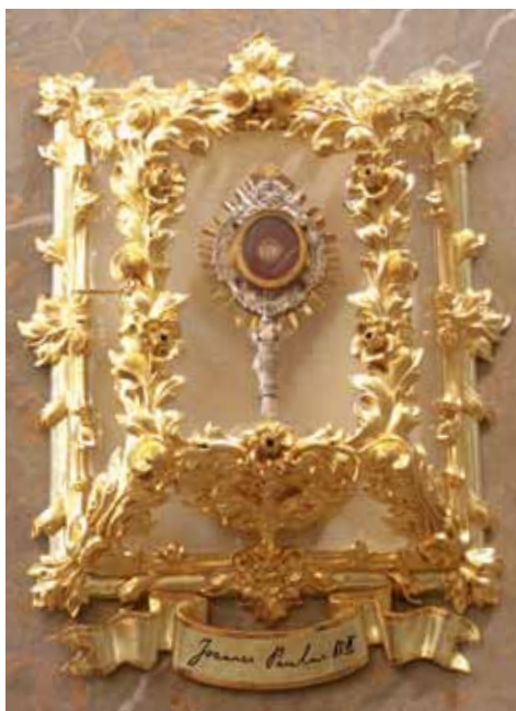
Relikviář sv. Jana Pavla II., detail.