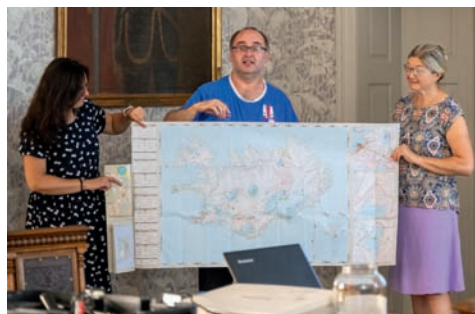
Přednáška o Islandu, Svatý Kopeček u Olomouce, Sousedská slavnost 19. srpna 2023.