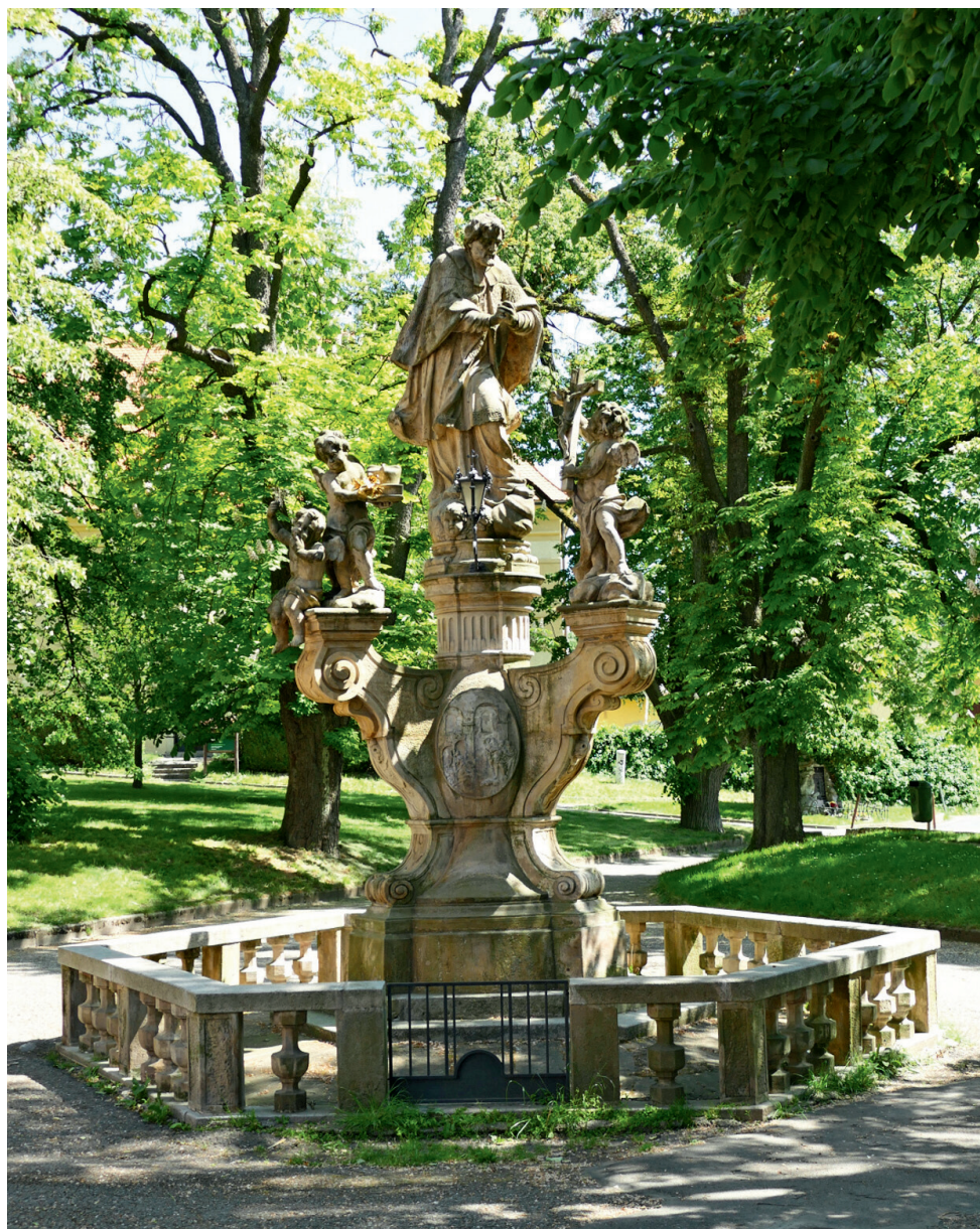
Sousoší Jana Nepomuckého na Svatém Kopečku u Olomouce. Foto: Jan Gottwald

Vydala Matice svatokopecká pro vnitřní potřebu ■ Uzávěrka textů: červen 2024 ■ Fotografie: Arcibiskupství olomoucké / Jiří Fraiř, Archiv Matice svatokopecké, Jan Gottwald, Martin Kučera, Martin Stecher, archiv rodiny B. Smejkal, Vědecká knihovna v Olomouci ■ Grafická úprava: Jana Krejčová ■ Grafické zpracování: Typografický design Zdeňka Pospíšilová ■ Tisk: RV DESIGN, www.rvdesign.cz ■ Svatý Kopeček 2024 ■ 300 výtisků ■ Neprodejně ■ www.maticesvatokopecka.cz , www.svatykopecek.cz