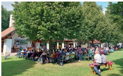
Obálka nové publikace o Stojanově na Velehradě, kterou vydala Matice velehradská. VIII. pouť moravských matic tentokrát hostila Matice svatoantoninská.