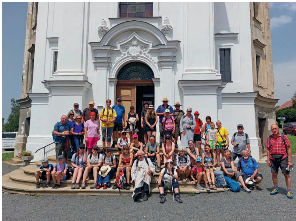
Pěší pouť Svatý Kopeček – Svatý Hostýn – Velehrad, odpočinek v Tršicích, 30. červen 2024.