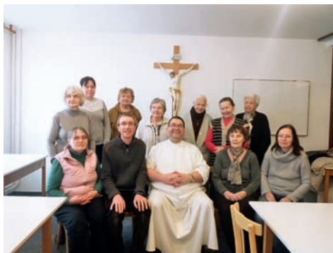
Účastníci postní duchovní obnovy na Velehradě.